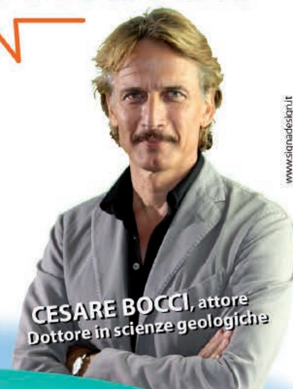
CESARE BOCCI , attore Dottore in scienze geologiche