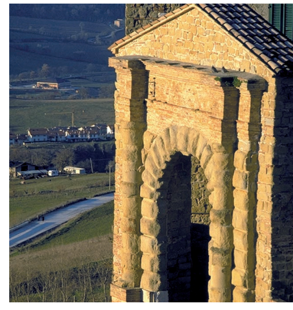
Camerino, Porta Malatesta già porta San Giacomo