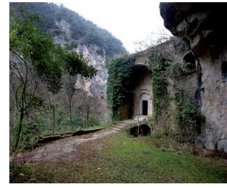
San Severino Marche, Grotte di Sant'Eustachio