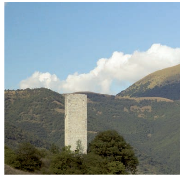
Rocca di Serravalle di Chienti