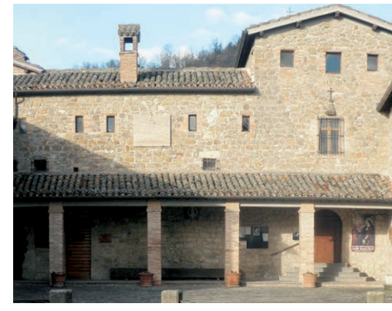
Convento di Renacavata