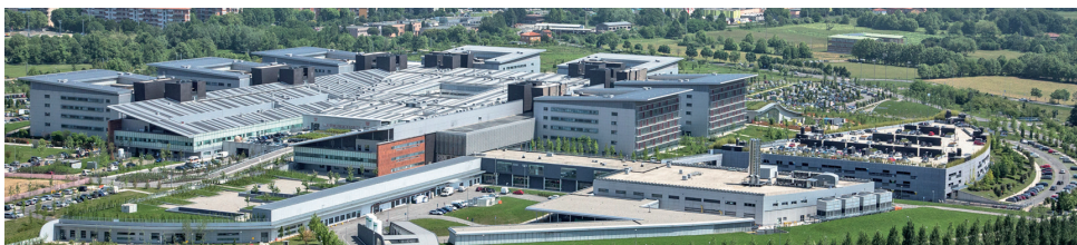
Bergamo Azienda Socio Sanitaria Territoriale 'Papa Giovanni XXII'